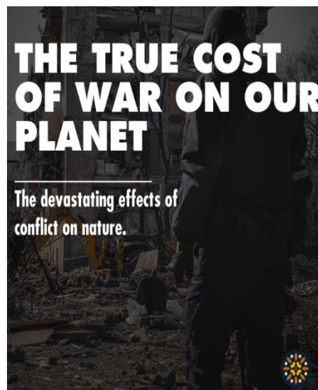
Рис. 2 [4]

Показовими є гасла « There is no peace after nuclear war » (Рис. 1) та « The true cost of war on our planet » (Рис. 2). У першому постері домінує стратегія апеляції до страху через акцентування на незворотності наслідків: вислів викликає відчуття безвиході й усвідомлення загрози глобального знищення. Категоричність твердження посилюється використанням заперечної конструкції « there is no », яка унеможливорює альтернативне прочитання і формує песимістичну модальність висловлювання. Паралельно реалізується контрастна стратегія через протиставлення семантично протилежних концептів « peace » і « nuclear war ». Такий контраст не лише підсилює емоційний ефект, а й створює смисловий парадокс: мир (як бажаний стан) стає неможливим після ядерної війни, що стимулює критичне осмислення екологічних наслідків воєнних дій. Темпоральна маркованість через прийменник « after » актуалізує ідею про незворотність руйнування екосистем та неможливість повернення до попереднього стану довкілля.