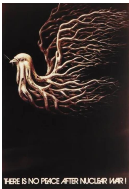
Рис. 1 [3]